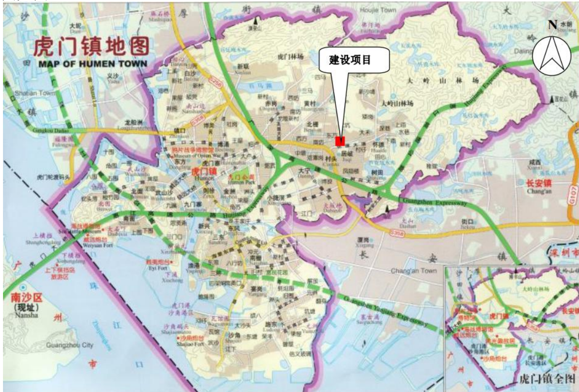
图 3-1 厂区地理位置图

东莞市正伟电线电缆有限公司位于东莞市虎门镇居岐大坑路 27 号厂房（地理坐标：N22°50'0.55"，E113°43'19.67"），地理位置见图 3-1，厂区平面布置及监测点位图见图 3-2。