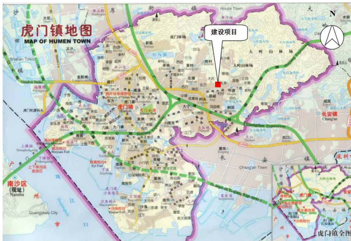
图 3-1 厂区地理位置图

东莞市海星特种玻璃科技有限公司位于东莞市虎门镇怀德社区大埔路 15 号一楼 101，地理位置见图 3-1，厂区平面布置及监测点位图见图 3-2。